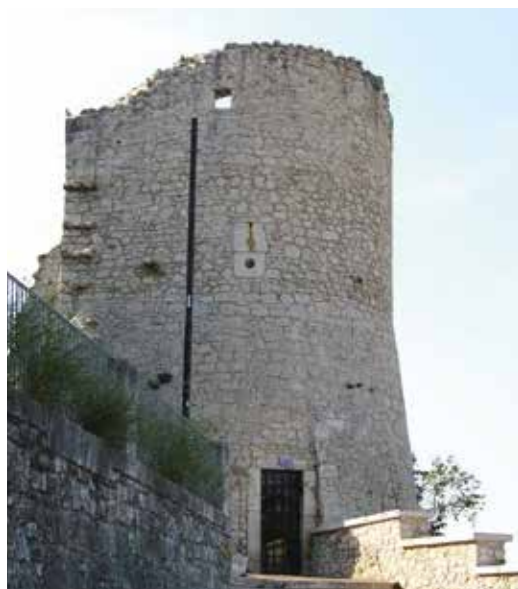
La Torre Terzano