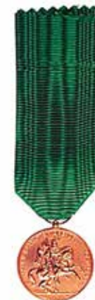
Medaglia Mauriziana al merito di dieci lustri di carriera militare

Anche al personale della Polizia di Stato viene concessa analoga decorazione dal Ministero dell'Interno, con nastro tricolore al centro e blu ai lati, su tre classi: di Bronzo per 20 anni; d'Argento per 30 anni; d'Oro per 35 anni. ◆