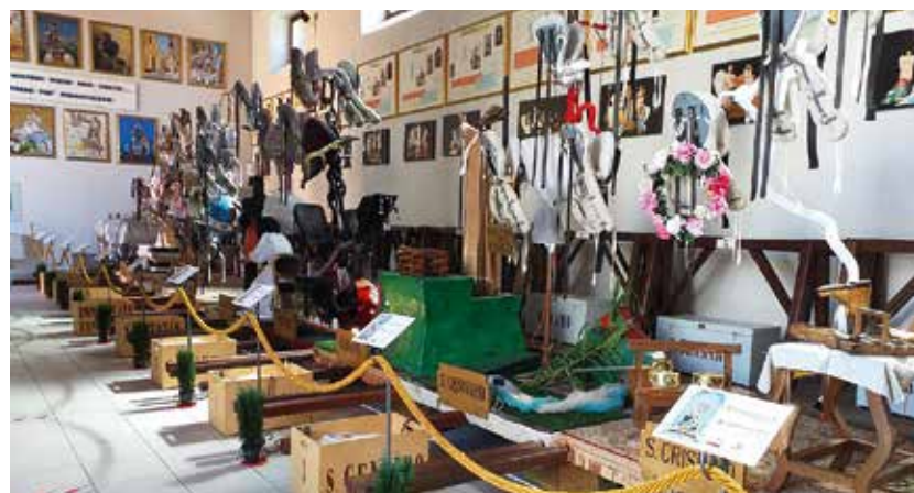
Il Museo dei Misteri