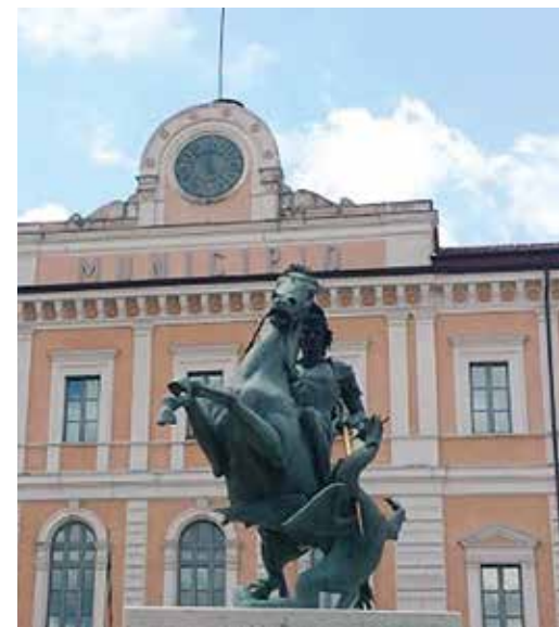
Palazzo San Giorgio

A San Giorgio è intitolato anche il Palazzo Municipale e nella piazza adiacente il Comune, piazza Vittorio Emanuele II, proprio di fronte all'ingresso, a settembre 2012 è stata inaugurata una statua in omaggio al Patrono nella classica posizione a cavallo che trafigge il drago con la sua lancia.