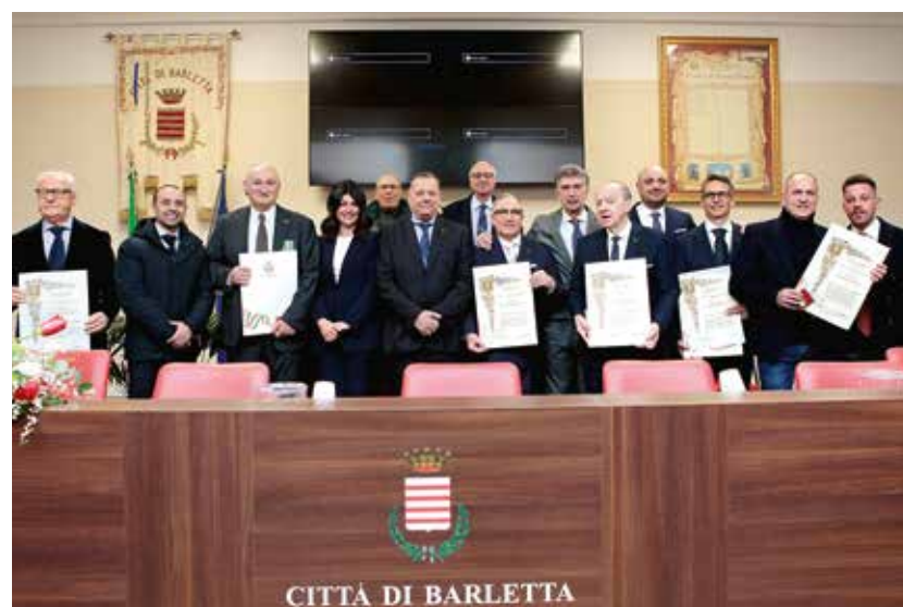
I soci UNCI insigniti di Benemeranza Civica