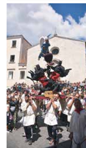
Particolare della processione dei Misteri per le strade della città nella domenica del Corpus Domini