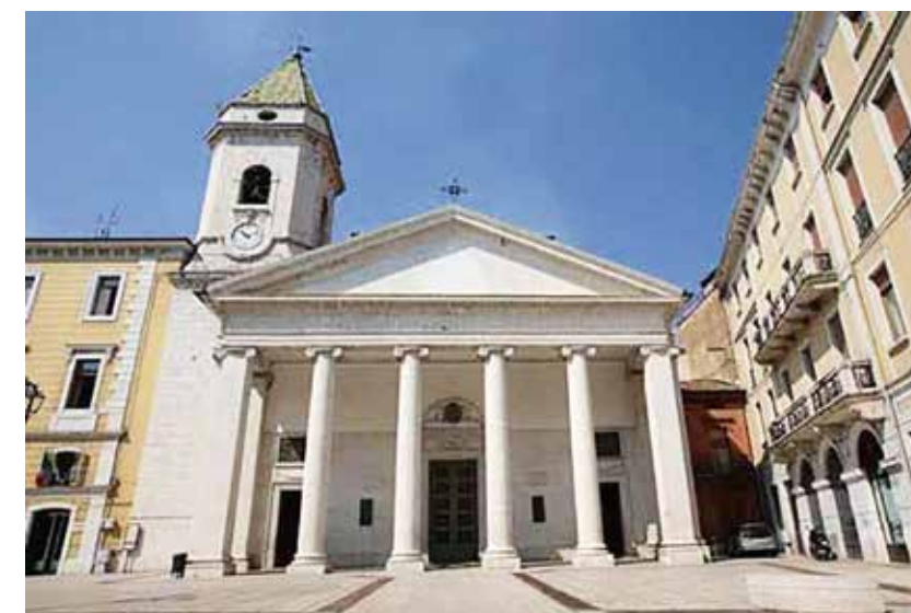
Cattedrale della Santissima Trinità